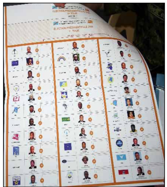
Sur cette image, on peut voir à quoi ressemble le bulletin de vote pour le premier tour de la présidentielle.

Vu le grand nombre de candidats inscrits aux législatives, ce bulletin se présente sous forme de syllabus, avec plus ou moins dix feuilles car, précise un responsable de la CEI, certaines des 169 circonscriptions comptent plus de 500 candidats. C'est le cas notamment de la circons-